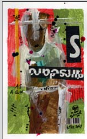
Billès chez Xina à Bayonne et aux «ateliers du moulin» à Espelette