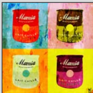
Collectif eL b0s à Biarritz