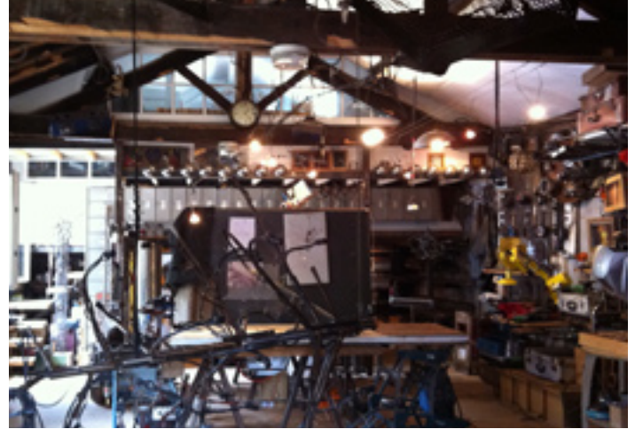
Atelier Moa, 9 Impasse Urkia***

Arcad a été ravie de collaborer avec le Service des Affaires Culturelles de la Ville de Biarritz sur cet événement et souhaite (comme les artistes et visiteurs) pouvoir réitérer cette expérience.