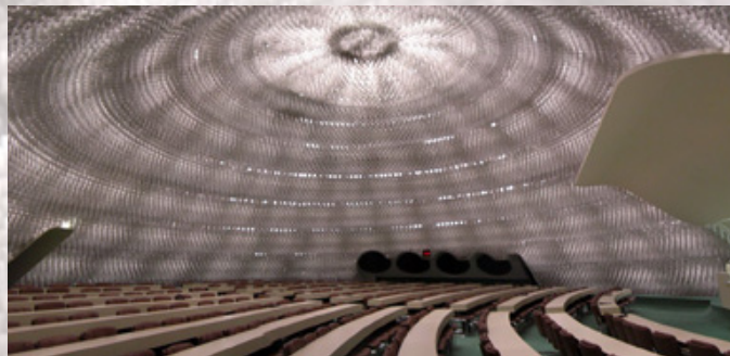
Salle Oscar Niemeyer, architecte d'origine brésilienne, un lieu extraordinaire tout trouvé pour recevoir l'Assemblée Générale de la MDA***