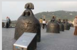
Manolo Valdés à Madrid

Le Vaisseau de Pierre vous invite au vernissage de l'exposition ESCALE 2009 qui aura lieu vendredi 9 octobre prochain à la salle Sanoki d'ITXASSOU (près du fronton) à partir de 18h30. Bien à vous. Pr Harriarka.Isa d'Amorots.