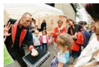
Festival jours heureux

Biennale d'Art Contemporain : recherchons bénévoles pour le montage (23 au 27) et le