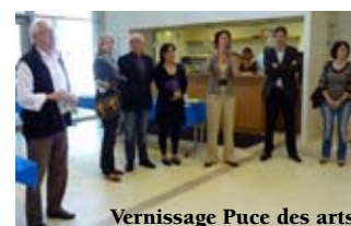
Vernissage Puce des arts