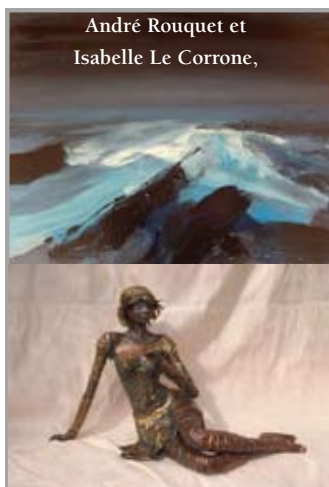
André Rouquet et Isabelle Le Corrone,

http://www.arcad64.net/repertoire%20artiste/andre%20rouquet.html - expose avec Isabelle Le Corrone, jusqu'au 06.05 à la Galerie des Corsaires, Bayonne, 16 rue pontrique ; infos 06 46 46 79 91