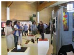
La Puce des Arts

L'aide à la professionnalisation des Artistes s'intensifie : nous mettons en place un temps d'information spécifique tous les mardis après-midi au Château d'Arcad et nous avons sollicité Radiokultura.com, radio-internet pour que l'intervention sur le Droit d'Auteur soit retransmise.