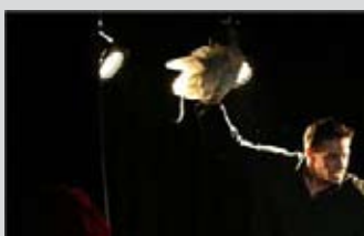
Cie les Cous lisses