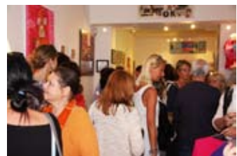
Inauguration de Xuri Kub

autres performances seront actualisées sur facebook. Lu au Sa, 10H- 13H 16H – 19H contact 06 61 81 01 10