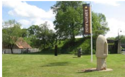
Aura de Régis Pochelu

Retrouvez-les infos professionnelles sur www.arcad64.net < actuscopie