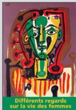
Différents regards sur la vie des femmes à St Jean-de-Luz