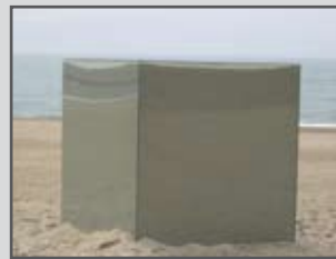
Biennale d'art contemporain d'Anglet

☐ 13.06, 3ème édition de «La Fête du Conte» ① http://www.vins-jurancon.fr